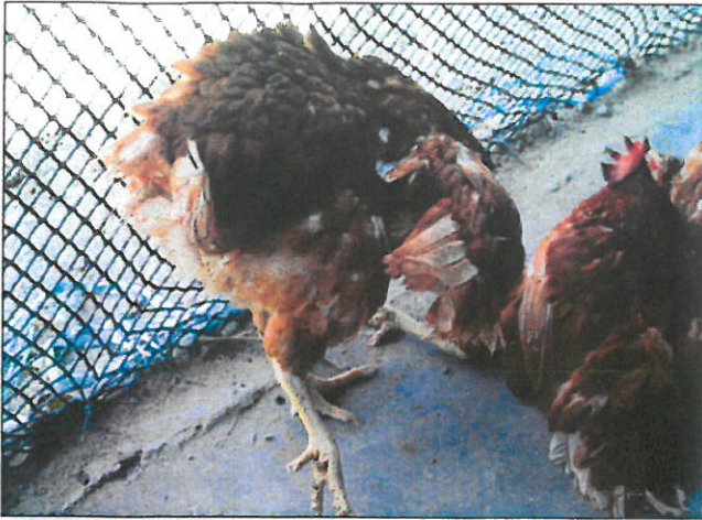
Objawy nerwowe w przebiegu zakażenia welogenicznym szczepem NDV