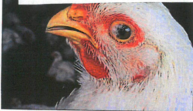
Zapalenie spojówek w zakażeniu NDV