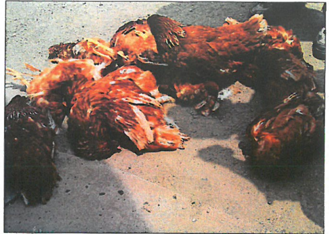
Masowe upadki w przebiegu niektórych form ND